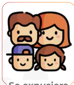
Se expusiera a mi familia