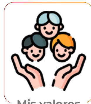
Mis valores personales