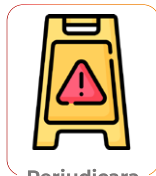
Perjudicara o pusiera a alguien en riesgo